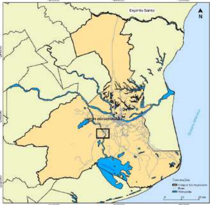
Mapa de Localização de Ururá